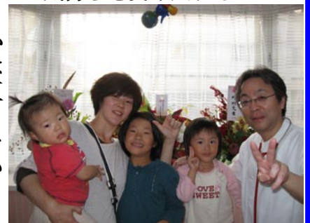
(少年写真新聞「ほけんニュース」掲載予定原稿)

かかりつけ医とは、よく診てもらってる医師という意味だけではありません。病気の背景にあるものまで把握して、子どもだけでなく親のケアまでしてくれる、それがかかりつけ医と考えています。かかりつけ医を見つけるためには、コミュニケーションが重要な要素です。何でも聞け、お互いの考えを受け入れることができる関係です。先入観について書きましたが、先入観を持ちすぎると相手の考えを肯定しにくくなります。今の親御さんのよい医師の条件には、“患者の言うことを何でも聞いてくれる”があります。それを否定するつもりはありませんが患者は子どもです。やはり小児科医は“お母さんのいうこと”より、“子どもに必要なこと”が重要と考えています。お互いの気持ちを受け入れることができるのが“かかりつけ医”であり、“かかりつけ患者”ではないでしょうか。互いの立場を尊重し、何でも聞ける関係を築きあげていきたいものです。